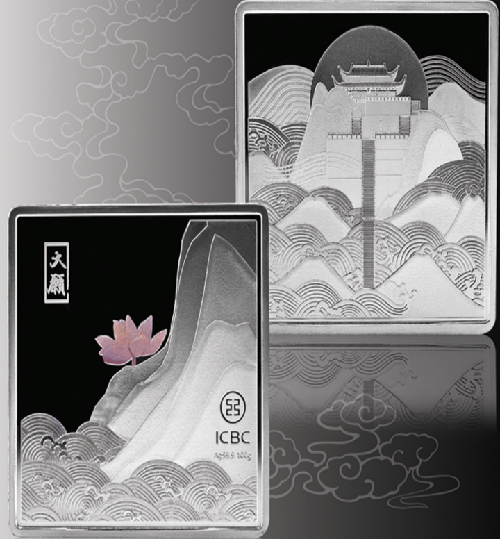
Da Yuan · 大愿 天台圣莲 99.9 50g 100g

天台寺又名“地藏寺”、“地藏禅寺”,位于九华山的天台峰顶,海拔1306米,为九华山主要标志之一,其登台阶梯宛如天梯一般直立于祥云间。本品以独一无二的绘画表现手法,将九华天台寺和四峰山形按比例绘制,一行天梯通途直达佛光普照下的寺院,好似连接凡尘与清心之境的语言。本品以一朵清莲绽放于九华山山崖间,配以山水写意的表现手法,仿佛佛约间那缕清香气,悠悠然得禅意。九华山又称莲花佛国,取材莲花恰合其意。世间花先开花后结实,莲花则在开花同时,结实的莲蓬已具,因此被佛家视为能同时体现过去、现在、未来、莲华,即妙法。