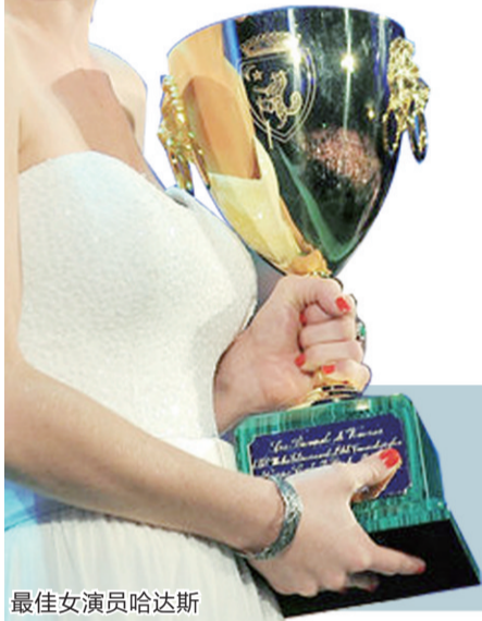
最佳女演员哈达斯

昨日凌晨,第69届威尼斯电影节闭幕式在水城举行,与开幕式一样,闭幕式红毯也没有太多的大牌明星参加,评委们成为了闭幕式红毯的明星,但是混乱依旧,在颁奖时不仅颁错奖杯,还将奖杯掉落在地上。本届电影节影帝影后分别由杰昆·菲尼克斯、菲利普·塞默·霍夫曼和哈达斯获得,最佳影片“金狮奖”由韩国导演金基德执导的《圣殇》获得。中国影片《三姊妹》则摘得地平线单元最佳影片。