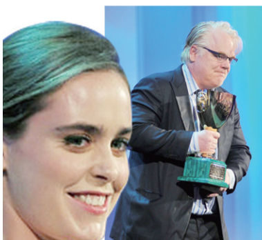
最佳男演员霍夫曼