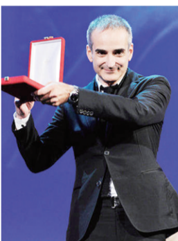
最佳编剧阿萨亚斯