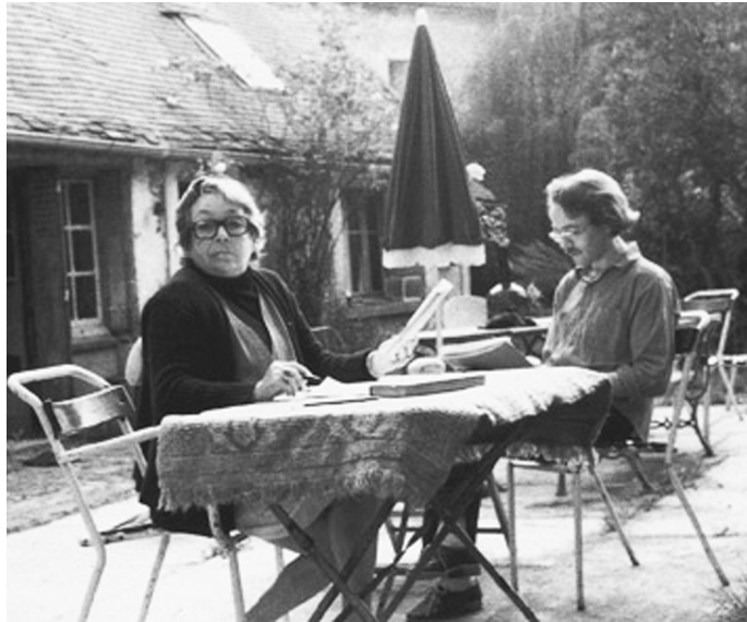
1985年,杜拉斯与安德烈亚在诺弗勒堡