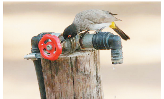
渴死了,找点水喝真不容易