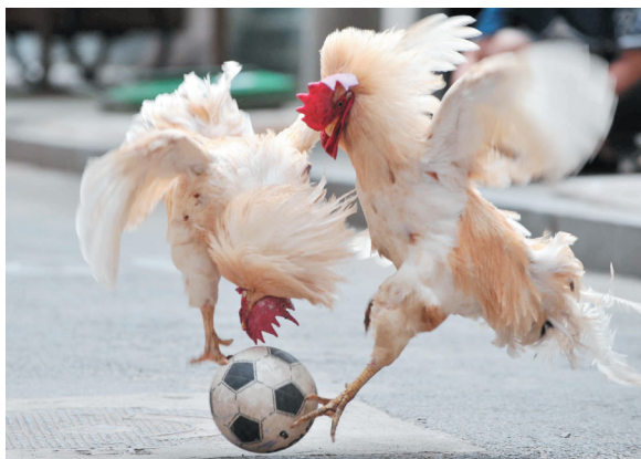
神鸡,中国足球就看你们了