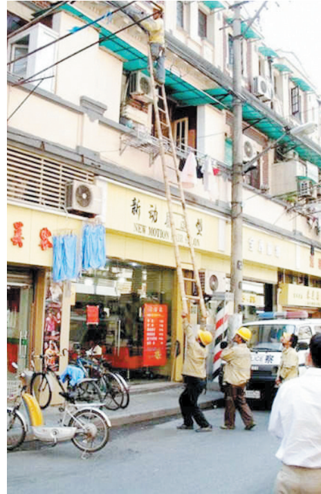
您怎么不去参加奥运举重比赛?