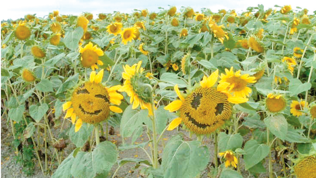
植物们心情不错,难道僵尸已经被消灭光了?

前两年,一款叫“植物大战僵尸”的小游戏风靡网络,成为办公室白领打发时间、发泄情绪的保留节目。这幅图一定勾起了你关于这款游戏的回忆吧。