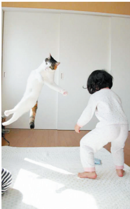
这招“飞猫在天”我轻易不示人的