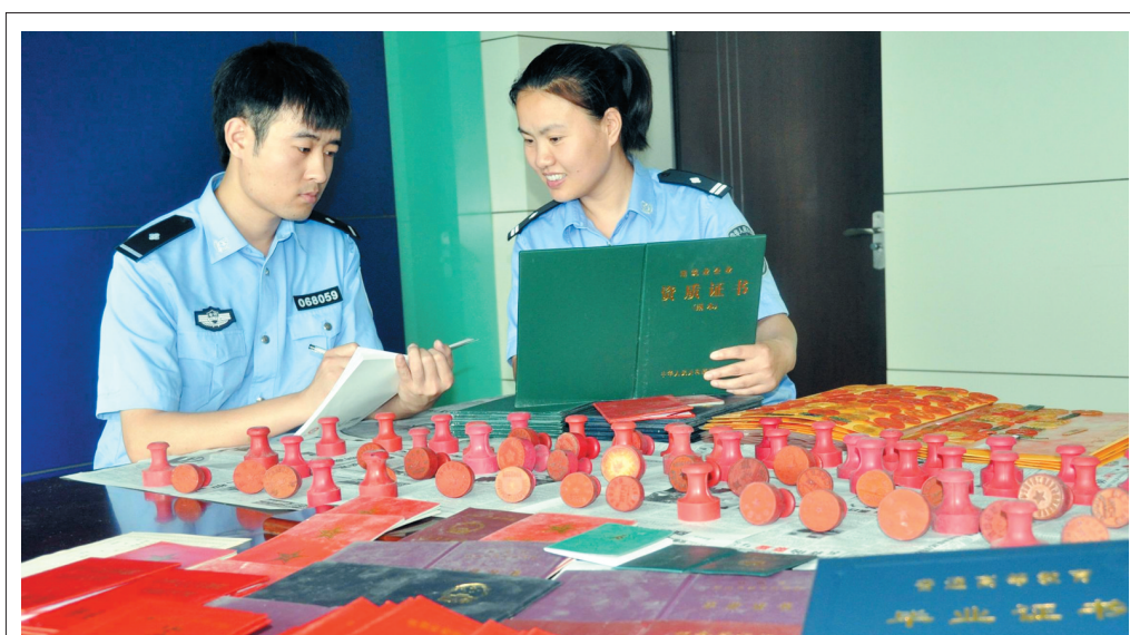
近日,亳州市公安局治安支队一举打掉一个由外省籍犯罪嫌疑人组成的特大制售假证犯罪团伙,端掉制造假证窝点两处,抓获犯罪嫌疑人9名,收缴制证设备3套,伪造印章2000余枚,伪造二代证及各类假证10000余份。图为民警对收缴的伪造印章、证件进行登记造册。