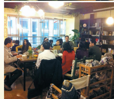
读书会上会员各抒己见