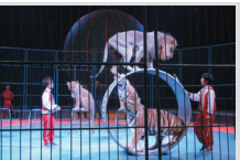
马戏大世界 驯狮虎