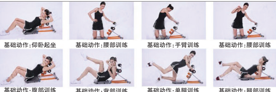
基础动作: 仰卧起坐 基础动作: 腰部训练 基础动作: 手臂训练 基础动作: 腰部训练 基础动作: 腹部训练 基础动作: 背部训练 基础动作: 单腿训练 基础动作: 腿部训练

风靡欧美的“乐尔多”收腹机,根据人体工学和航天材料精制而成,不吃药、不节食、不费力,个把月就能达到完美的瘦身效果。