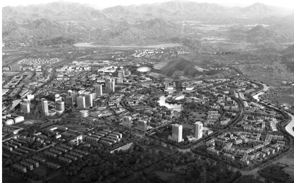
方案二汤池效果图