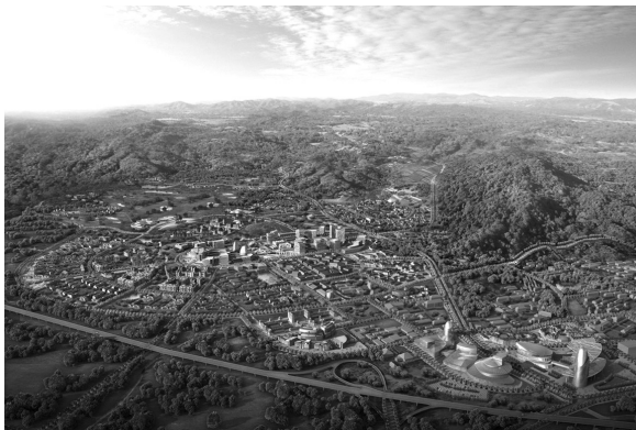
方案二半汤效果图