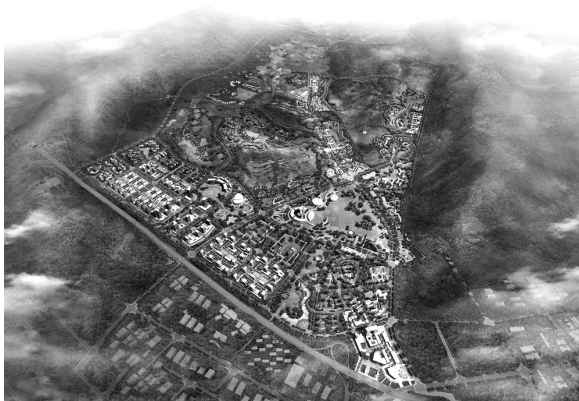
方案一半汤效果图