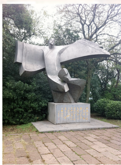
采石矶的李白石雕