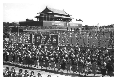
1958年国庆，钢铁工人队伍