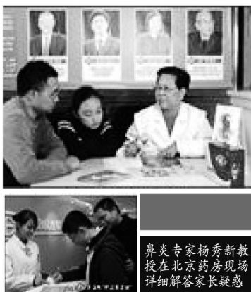
鼻炎专家杨秀新教授在北京药房现场详细解答家长疑惑

合肥某重点中学的张老师这段时间发现了一个奇怪的现象:以往班上学习注意力不集中、上课爱睡觉、总擤(xing)鼻涕、滴鼻炎水的那几个患鼻炎的学生,最近学习特别的努力,上课不睡觉了,也不滴鼻炎水了,擤鼻涕的现象也没有了,性格也开朗了许多,特别的爱学习,最近居然在几次的摸底考试中,都获得了不小的进步。别的班的班主任老师也说,他们班的那几个老爱流鼻涕,打喷嚏、有鼻炎的学生,最近也进步的特别快,这是怎么回事呢?