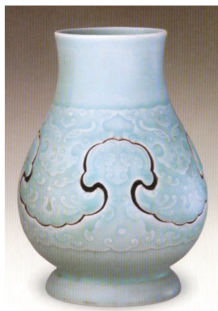
玲珑交泰瓶

以乾隆景德镇窑粉青釉暗花夔纹交泰瓶为例,此瓶高16厘米,口径6.9厘米,足径8厘米,瓶口微撇,短颈,溜肩,鼓腹,圈足。通体及足内均施粉青釉。腹部中间镂空成仰覆如意头形,上下两部分互相勾套,既可活动,又不能拆开。如意头形内有凸起的夔纹装饰。足内有青花“大清乾隆年制”六字三行篆书款,现藏于北京故宫博物院。 王家年