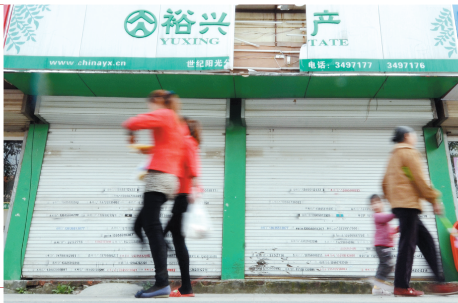
裕兴门面店现在大门紧闭