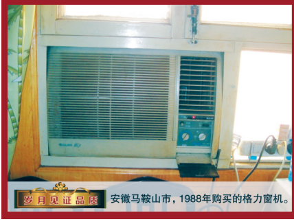
格力空调免费维修，十年如一日 为了让广大格力空调用户，特别是已经

好消息，格力空调免费维修月即将启动啦！随着气温的持续下降，空调即将步入使用高峰期。为了让您的工作和生活不受影响，格力空调提醒您：请及早开启家中空调制热运行半小时，如遇故障，请拨打格力空调全国统一售后服务热线：0551-2666666(24小时接听)，我们将依次安排维修人员免费上门为您维修。据悉，格力空调第20届免费维修月将于11月1日如期启动。明天起，所有格力空调用户(无论您什么时候购买，哪怕是20年前购买)，均可享受免费维修。