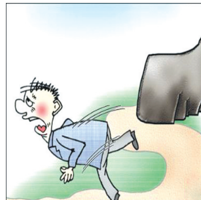
生活的悲剧不在于翻不过高山,而在于经常被不起眼的小石块所绊倒。