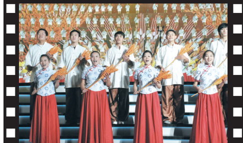
手持金色的麦穗,唱出丰收的希望