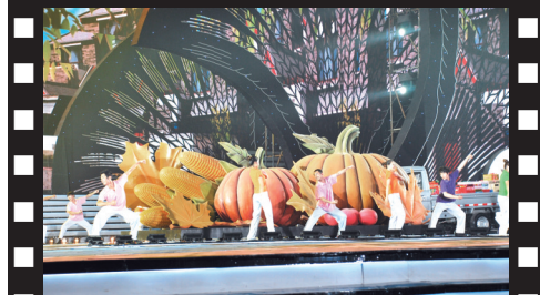
玉米、南瓜、收割机……把舞台装扮成“农家田园”