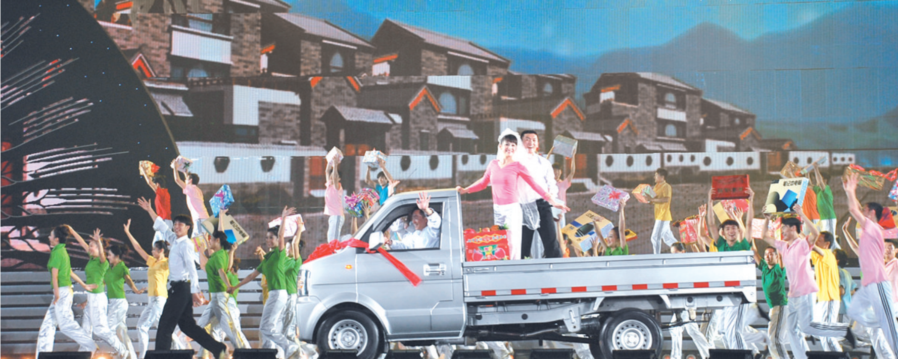
歌唱幸福生活,农民奔上小康路