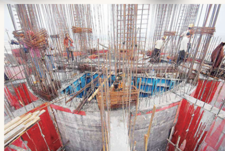
这里就是今后新桥机场的“眼睛”和“大脑”