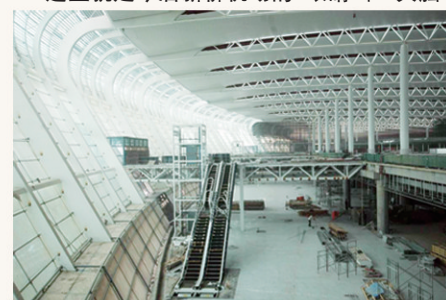
自动扶梯即将安装完毕