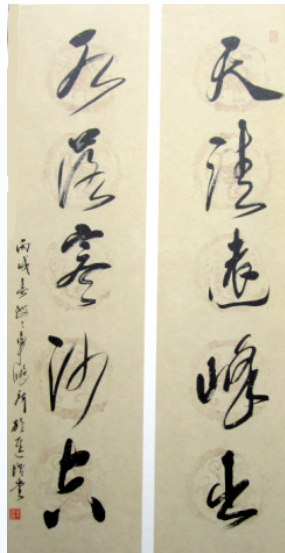
作者:车鹏飞(上海中国画院创作研究室主任、国家一级美术师) 尺寸:132cm x 32cm x 2