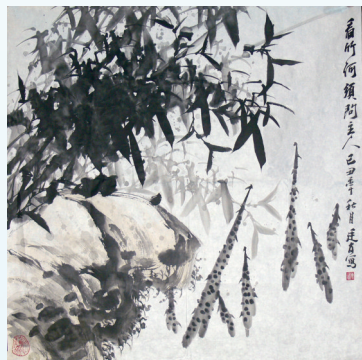
作者:陈廷友(安徽浙江国画院常务副院长、安徽文史馆特邀研究员) 尺寸:68cm x 68cm