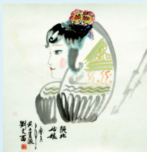
作者:刘文西(原中国美协副主席,现任中国美协顾问、陕西省美协副主席) 尺寸:68cm x 68cm