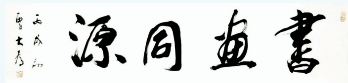
作者:刘大为(中国美协主席) 尺寸:34cm x 136cm