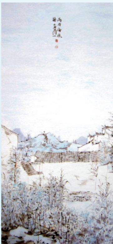
作者:林容生(福建省美协副主席、福建师范大学美术系教授) 尺寸:136cm x 68cm