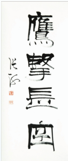
作者:张海(中国书协主席) 尺寸:102cm x 51cm