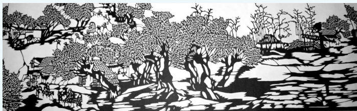
类别:剪纸作品——清明上河图(本图仅展示部分作品) 尺寸:6m