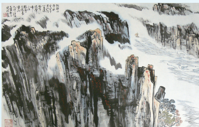
作者:陆晓波(上海教育出版社美术编辑) 尺寸:96cm x 61cm