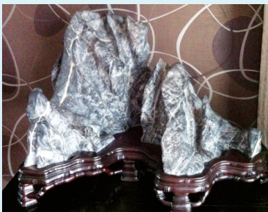
类别:灵璧石 尺寸:72cm x 56cm x 55cm