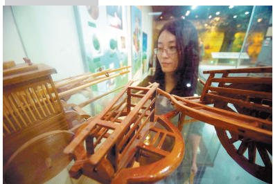
按比例缩小的农具模型