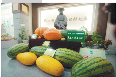
农交会上的巨型瓜果