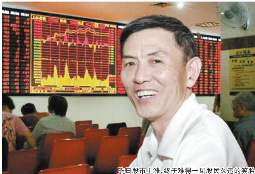
昨日股市上涨，终于难得一见股民久违的笑脸

昨日，沪深股市一改往日阴跌格局，在早盘探底之后，便一路强劲上涨。从板块上看，领头羊当属核电、水泥、煤炭和金融股，截至收盘，沪指上涨2.66%，报收2512点，成交882亿元；深成指上涨2.93%，报收10991点，成交717亿元。针对昨日的股市惊天逆转，投资者一是想知道，究竟是什么因素，使疲弱已久的股市一举振作起来；二是想知道，本轮行情是昙花一现的反弹，还是大行情反转的开启？