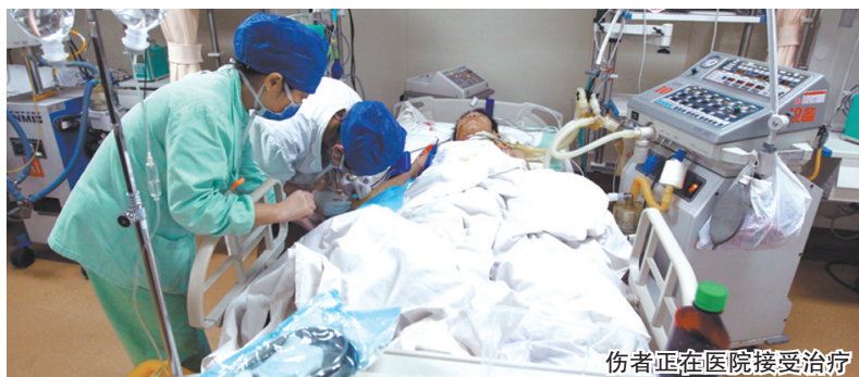
伤者正在医院接受治疗

向西向河流,东海救助局人员也火速赶到。他们在高架桥下的河道里不停搜索,防止有乘客坠入河中,所幸车上没人员掉入河中。