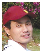
武汉科技大学金融证券研究所所长

电子商务只是一个新的业态而已,是传统业态的发展和丰富——“电子”是手段,“商务”是本质。如果不能像传统商务那样为客户创造价值,所有的电商都是浮云。