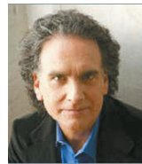
“股神”沃伦·巴菲特之子,慈善家

加工出口订单减少,加工利润稀薄,在中国还将持续相当时间。因为人民币升值进程远未终结,体面劳动提升工资水平正在进行时,物价上涨导致原材料采购成本增大,低附加值加工出口,为洋人让利?倒不如“出口转内销”,造福国人,降低物价。