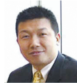
著名职业经理人,掌信彩通总裁兼首席运营官

我觉得中国青少年有一种非常迫切的压力,每个人都想成为最好的那个。因为事实上,不是每个人都能成为班里的第一名的,而且也有其他的方式让你获得第一名,让你获得想要的生活。有先入为主的一些词,像“成功”、“美好”、“完美”这些词,我们要重新定义它们。