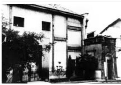
曾经的泰州新安会馆

1918年12月22日由李大钊、陈独秀创办的进步政治杂志《每周评论》在会馆北屋诞生,涇县会馆的知名度随之大增,此后即被作为杂志的编辑部驻地,张申府(周恩来入党介绍人)、周作人、高一涵等文化名流经常为其撰稿。涇县会馆也因此被誉为“新文化运动的喉舌之地”。《每周评论》自26期起由来自距涇县不远的绩溪人胡适主编,但杂志舆论导向此后发生变化,1919年8月30日被北洋军阀政府查封,仅出36期。