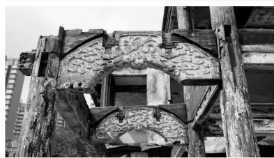
从徽宁会馆的木雕上可以看出往昔的辉煌