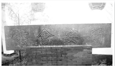
杭州新安会馆只剩下了古碑