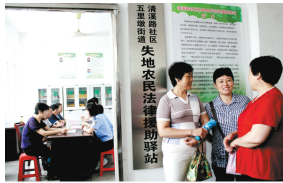
为失地农民提供法律服务的合肥市蜀山区清溪路社区“失地农民法律援助驿站”,昨日在安徽省警官学院正式挂牌成立,旨在服务城市发展和大建设中失地农民的法律需求,为他们提供法律援助。 柴慧 郎章正文/图

“召开听证会时,首先由社区负责人宣读申报城乡医疗救助相关文件,然后由申报者陈述自己的家庭情况及申报原因。陈述时,党员、群众代表可向听证陈述人询问情况,随后由社区低保员宣读入户调查结果,最后由社区党员、群众代表无记名投票,并当场公布结果,对不符合的申报对象当场说明不符合的原因及依据。”