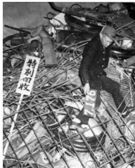
特别回收，回收来的破铜烂铁做武器