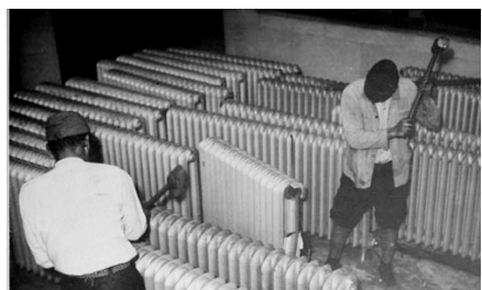
砸暖气片回收钢铁