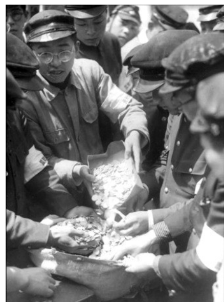
硬币不是用来溶化后做炮弹的，而是军费