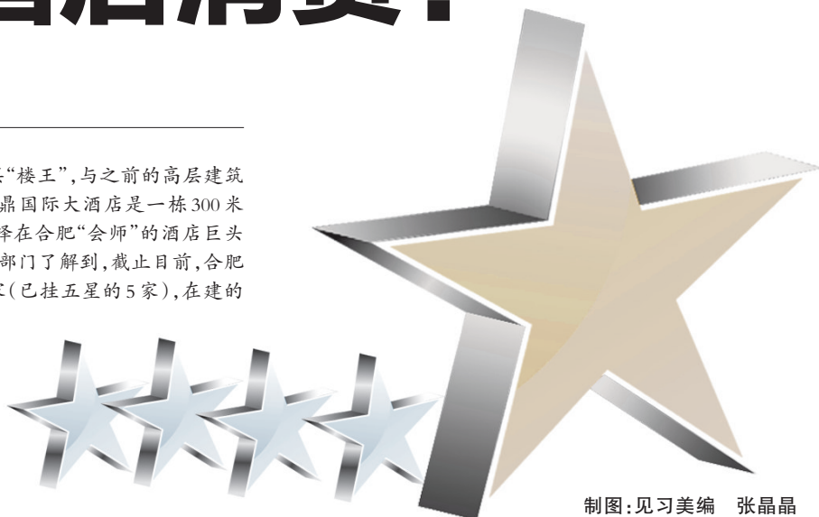
制图：见习美编 张晶晶

按照合肥现有的55家星级酒店测算，在合肥，每5家星级酒店中就有1家五星标准酒店。不过记者采访发现，虽然高端酒店“扎堆”，但投资商日子都挺“滋润”。