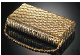
金嵌花嵌钻石手袋