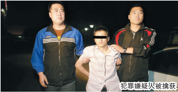
犯罪嫌疑人被擒获

故宫博物院 5 月 11 日上午就香港展品失窃一事召开新闻发布会,据悉,本次共 9 件展品被盗,2 件被追回的展品有破损情况。昨晚,嫌疑人被抓获归案。