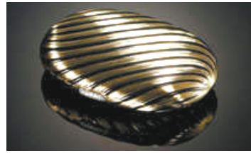
金嵌珐琅斜格纹化妆盒