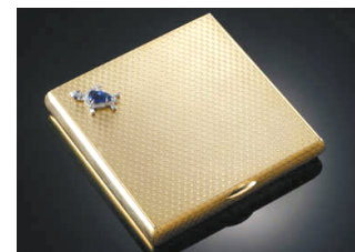
金嵌宝石龟饰化妆盒