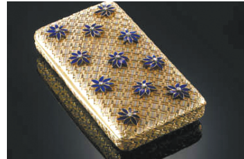
金嵌珐琅花饰化妆盒