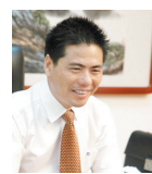
远东集团有限公司 董事长

年轻人们惊醒吧:这个世界上,除了男女情,还有母子情、父子情、兄弟情、师生情、友情、同事情……坚强地迈过情感生活中的每一道坎,是成熟和敢于担当人生责任的重要体现。