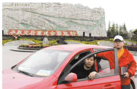
本报特派记者驾车抵达四川地震灾区