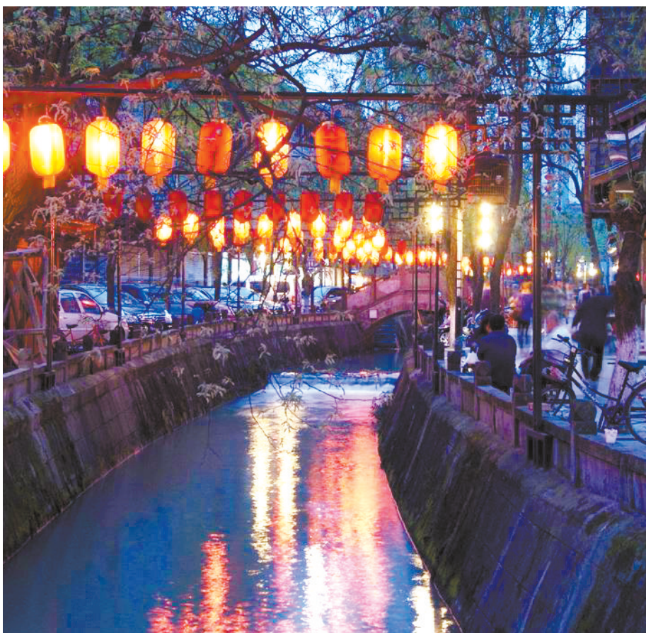
美丽的都江堰市夜景