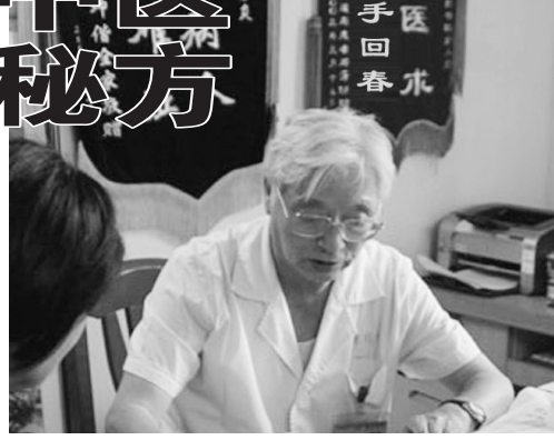
激素、安全无毒副，老人孩子等体质虚弱者请放心使用。

皮肤瘙痒久治不愈的患者均可拨打皮肤病专家咨询热线：0551-3418502，400-8878-097。(经销地址请见本版下方)