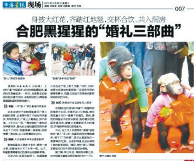
去年本报报道的皖星大婚