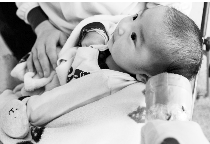
福岛空气中的放射性物质辐射水平持续微减

日本东京电力公司6日宣布,在采取注入阻水材料等措施后,福岛第一核电站2号机组的放射性污水已停止泄漏入海。东京电力发言人角田直树当天说,公司先前采取的举措似乎取得成功,东京时间6日晨5时38分,放射性污水停止泄漏。东京电力2日发现2号机组内的放射性污水经一处竖井裂缝泄漏进入太平洋,