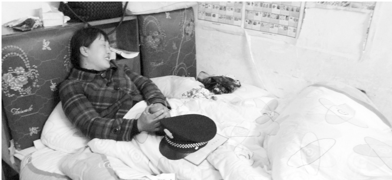
面对丈夫的离去,妻子悲痛不已