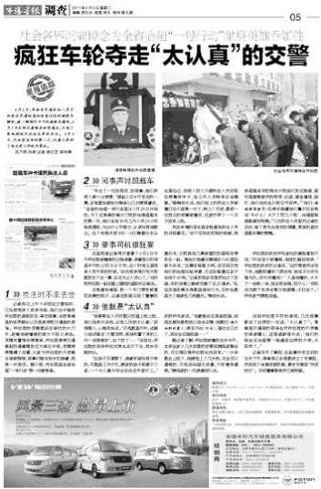
4月5日本报相关报道的版面