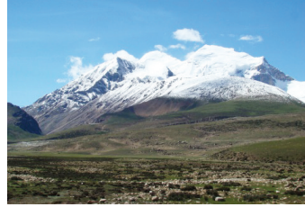
那曲气候恶劣,树木都无法成活,整个地区连一颗树都没有;但这里却出产世界最好的冬虫夏草。

真正的冬虫夏草产自青藏高原,主要分布在四川、青海、西藏等地。产地不同虫草的药效不同,虫草产地海拔越高,虫草产期越晚,药效品质也越好。四川虫草4-5月份产出,青海虫草5-6月份产出,西藏那曲虫草则在6-7月份才能产出。