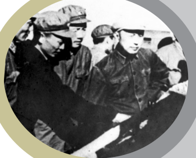
1960年钱学森在某导弹基地

考虑到他的身体不太好,中央没同意,后来将空军司令员刘亚楼调来当院长,钱学森当副院长,主要精力抓项目。从此以后,他一直当副职,从国防科委副主任、国防科工委副主任,到全国政协副主席,唯有中国科协主席是正的。