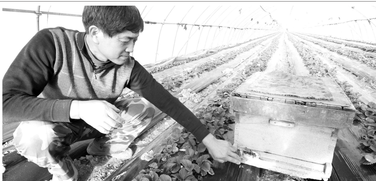
草莓即将开花,由于日前温度低、湿度小、日照短、昆虫少,严重影响草莓的授粉,合肥市庐阳区三十岗乡的草莓种植户想出了一个既科学又环保的好办法,他们把小蜜蜂搬进草莓大棚,让飞舞的蜜蜂为草莓授粉,不仅保证草莓的坐果率,还能节省人工成本。

据合肥电力公司的工作人员介绍,爆炸系该超市大型空调压缩机气体泄漏引发的。事故未造成人员伤亡。爆炸没有造成人员伤亡。