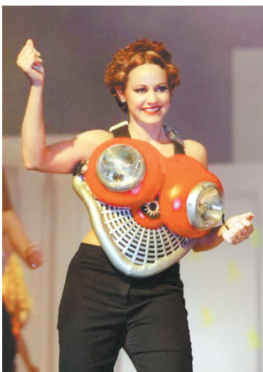
◀车灯文胸很潮,就是戴着太累