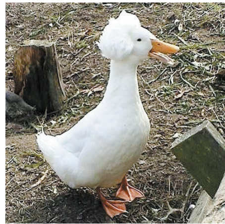
都说俺烫得好老土,555