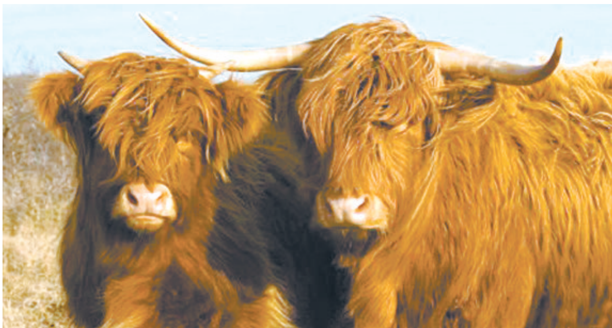
“非主牛”的时尚生活