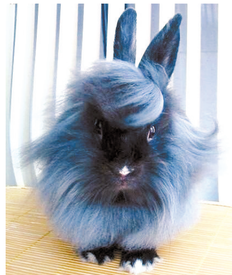
史上尺度最低的兔女郎