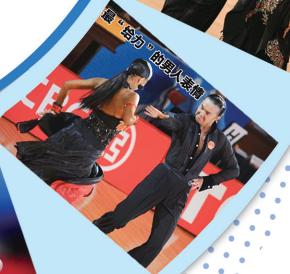
最“给力”的男人亮相