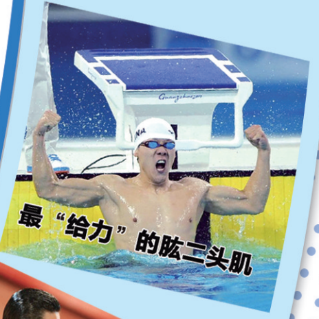
最“给力”的肱三头肌