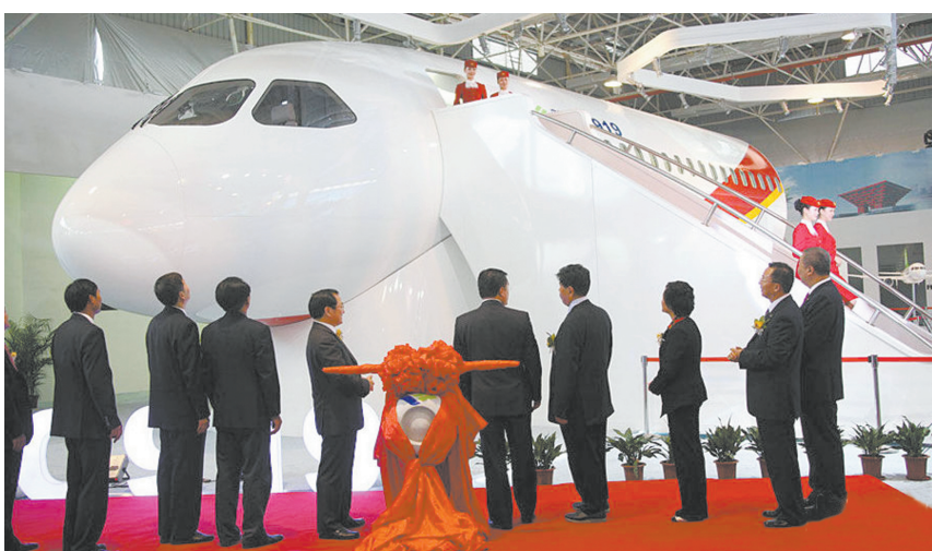
中国C919大型客机1:1展示样机

星报综合报道 11月16日上午,第八届中国航空航天博览会将在珠海航展中心开幕。国产大飞机C-919的局部样机首次亮相在中国航展上,同时本届航展中国空军将派出去年参加国庆阅兵几乎全部的机型,包括空警-200、歼-10等。