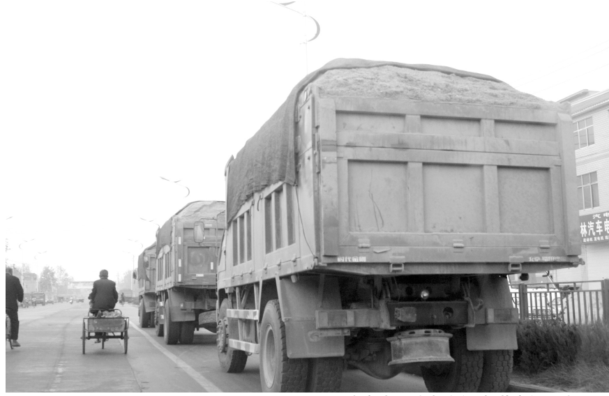
在阜南县城南路段,超载车辆排成了队