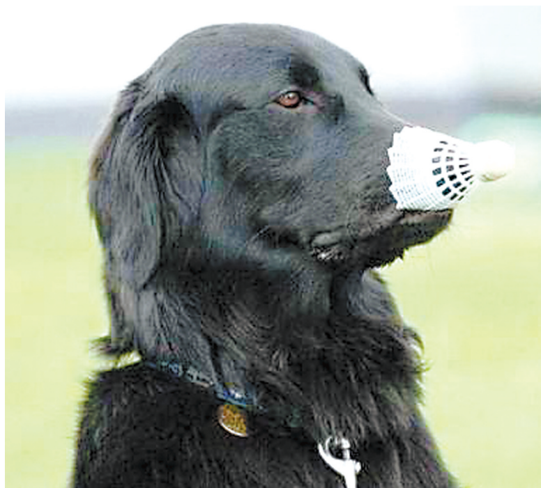
球童：羽毛球也招球童，感谢国家，感谢社会……