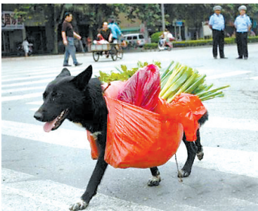
搬运工：找工作这么难，能混口饭吃就不错了。