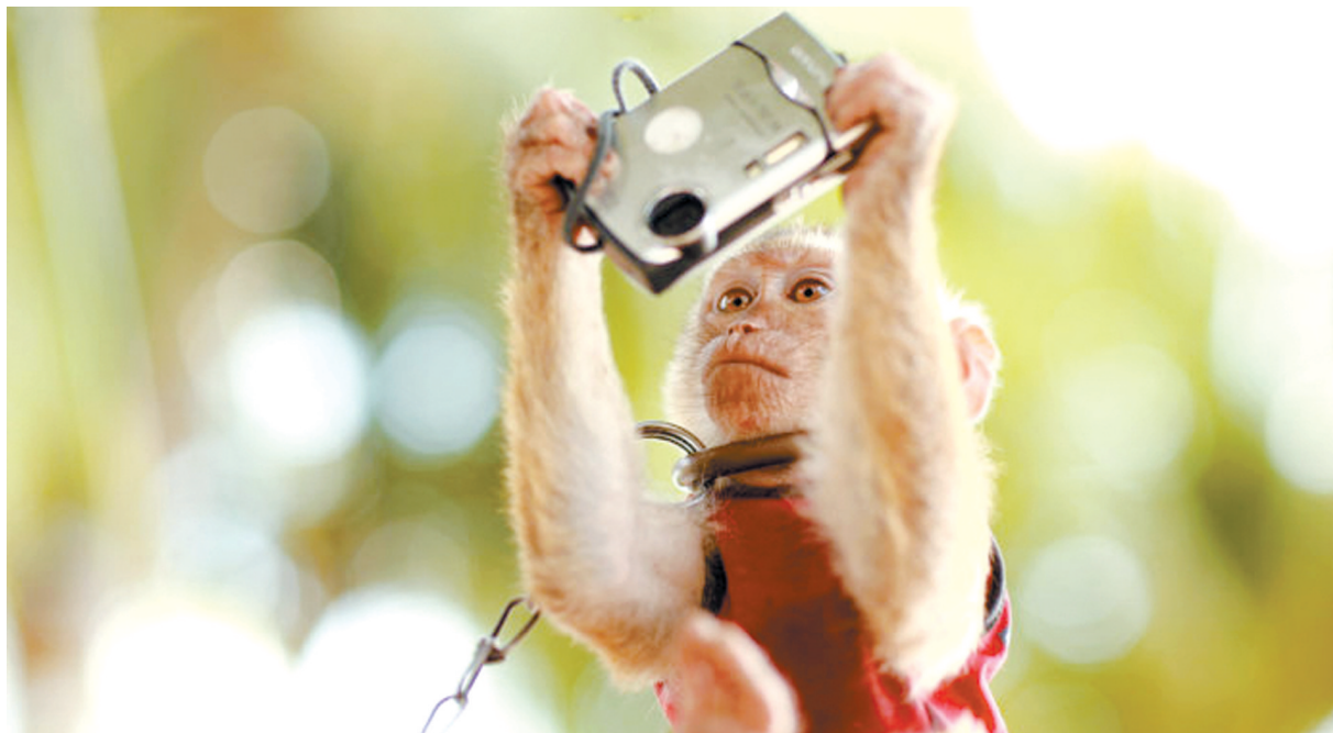
摄影师：不是吹牛，我用这个就能拍出单反的效果