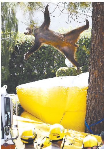
舞蹈演员：我本来是想秀一下太空步的……