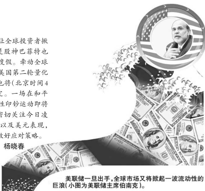
美联储一旦出手,全球市场又将掀起一波流动性的巨浪(小图为美联储主席伯南克)。