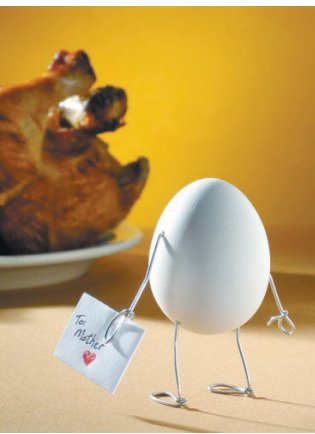
鸡蛋写给烤鸡的信