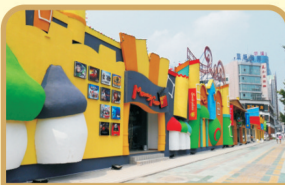
亦真亦幻的超炫实景样板街震惊合肥, 展示未来!