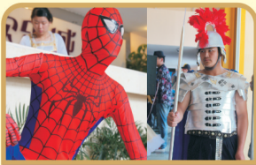
蜘蛛侠、古罗马卫士英姿飒爽, 守护着欢乐城中的所有来宾!