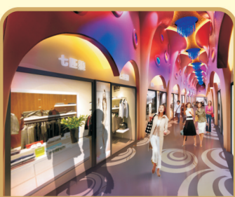
全场委托式经营, 租金收益 开发商全面担保, 天天坐享其成!