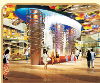
全场旺铺12年原价回购, 投资经营免去后顾之忧!