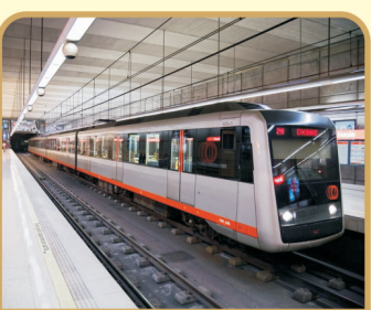
合肥首席地铁商业, 每日40万 地铁人流, 缔造财富奇迹!