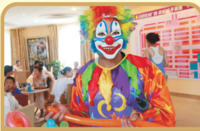
马戏团小丑逗乐全场, 从老人到孩子, 无一不为之哈哈大笑!