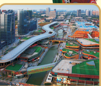
领跑合肥火车站元一商圈, 独占合肥城市商业黄金地。