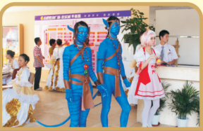
COSPLAY表演遍布全场, 想合影? 一部相机哪够用!