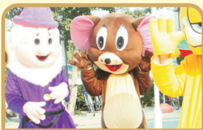
无数迪斯尼经典卡通人物与你亲密接触, 感受意想不到的欢乐体验!