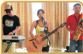
还有超炫R&B前线乐队前来助阵, 为欢乐城更添动感活力!