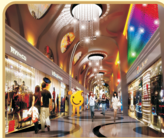
7米挑高, 自由分割分层, 商铺使用率可成倍增加!