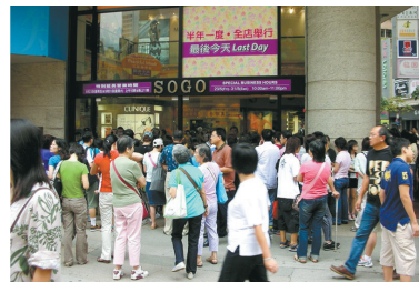
2 香港铜锣湾 集巴黎的奢华,米兰的典雅,伦敦的经典和纽约的简约风格于一身。