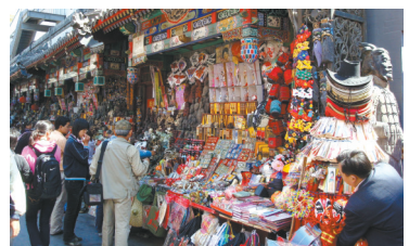
3 北京王府井 与京城古朴的文化氛围及炫目的商业气息相映成趣。

点评:这三处商业名街已经不仅是商品交易场所,更因其深厚历史和市民文化成为旅途绝佳风景。