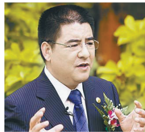
2 陈光标 各方面都想争做第一的慈善家。