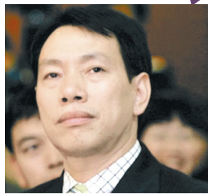
1 陈发树 组建国内最大的个人慈善基金“新华都慈善基金”。