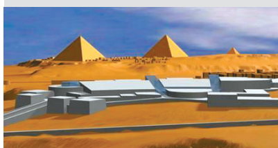
2 埃及吉萨大埃及博物馆 与周围几座金字塔浑然一体。