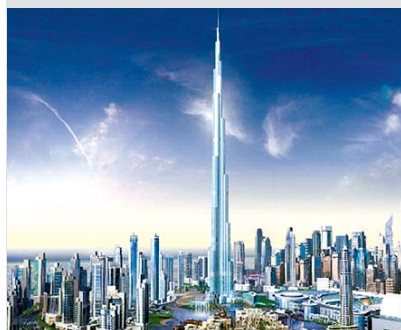
3 阿联酋迪拜大楼 大楼建设所用的混凝土数量同10万头大象一样重。

点评：这些建筑工程都让人过目不忘，多数规模庞大，当然也有少数颇有争议。 发榜机构：英国《泰晤士报》