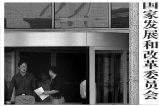
国家发展和改革委员会