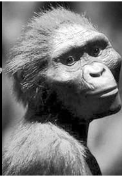
埃塞俄比亚发现340万年前切肉刀 南方古猿“露西”的模拟照片

此前人类使用工具的最早发现也是在埃塞俄比亚,在波里地区发现了250万年前用于宰杀动物的大量石器。据中新社